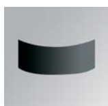
Pantalla direccional 180° Directional screen 180°