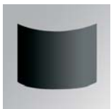
Pantalla direccional 180° Directional screen 180°